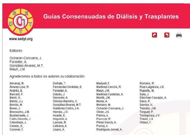
Figura 2. Relación de los autores de las guías consensuadas de diálisis y trasplante.

Las guías consensuadas de Diálisis y Trasplante han sido las siguientes: