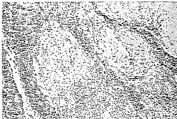
Fig. 1. Se observan restos de tejido linfóide, así como granulomas epitelioides con células gigantes.

Caso 3. — Mujer de 50 años, que desde hace 4 meses está incluida en programa de HD por