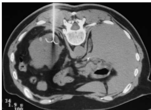
Figura 4. Caso 3: tomografía computarizada durante la radiofrecuencia, acceso posterior con el paciente en prono, electrodo localizado en el centro de la lesión.

mía izquierda por neoplasia de células claras grado 2 de Fuhrman y neoplasia primaria sincrónica de 1,2 cm en el polo inferior del riñón derecho. Se decide su tratamiento mediante RF por tratarse de un paciente monorreño con riesgo de desarrollar nuevos tumores renales en el futuro. Creatinina antes y después del tratamiento de 1,4 mg/dl. Se realizan dos ablaciones en la misma sesión. Como efecto colateral el paciente presentó molestias en la fosa renal derecha y la fosa ilíaca izquierda que desaparecieron en los pri-