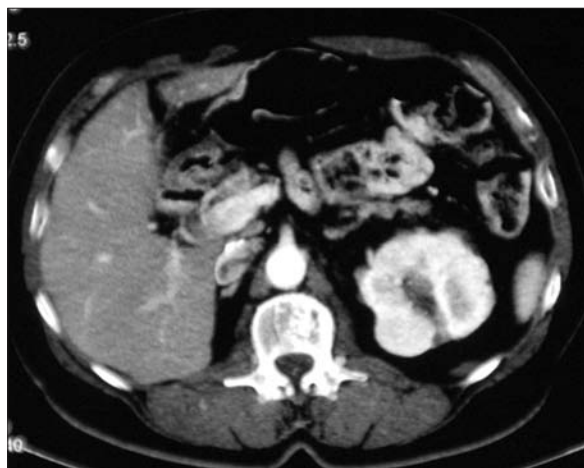
Figura 3. Caso 3: tomografía computarizada antes del tratamiento que muestra un nódulo hipercaptante de 3,2 cm, excéntrico, en el polo superior del riñón izquierdo.