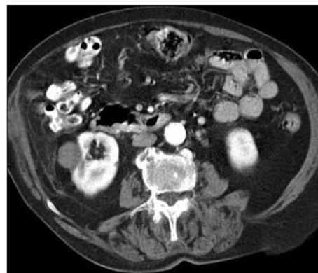
Figura 2. Caso 1: tomografía computarizada al mes de la ablación por radiofrecuencia, se observa el nódulo hipodenso sin captación de contraste intravenoso.

se controla con analgésicos. La función renal antes y después del tratamiento está dentro de límites normales (creatinina, 1 mg/dl). En la TC realizada al mes se objetiva una buena respuesta con un aspecto del tumor más hipodenso, una pared prácticamente imperceptible sin realces irregulares periféricos (fig. 2).