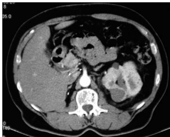
Figura 5. Caso 3: tomografía computarizada al mes de la radiofrecuencia, se observa un nódulo hipodenso sin realce irregular.