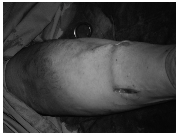
Figura 2. Trombosis de vena cefálica. Uso de vena criopreservada para unir arteria radial y vena dorsal.