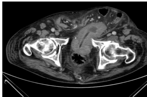
Figura 3 TAC abdominal previa a cirugía.

la figura 2 se muestra la evolución analítica de la función renal en el tiempo.